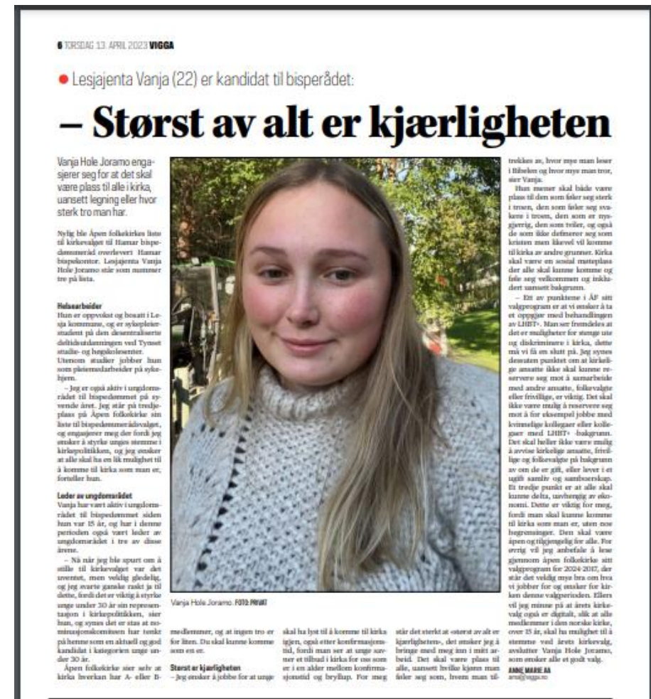
Eksempel fra lokalavisa Vigma